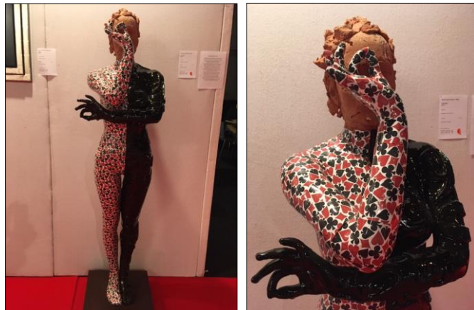
Kunstenaar: Marek Zyga, Polen

'Als je goed kijkt heeft bridgen best een zwart kantje.....!'