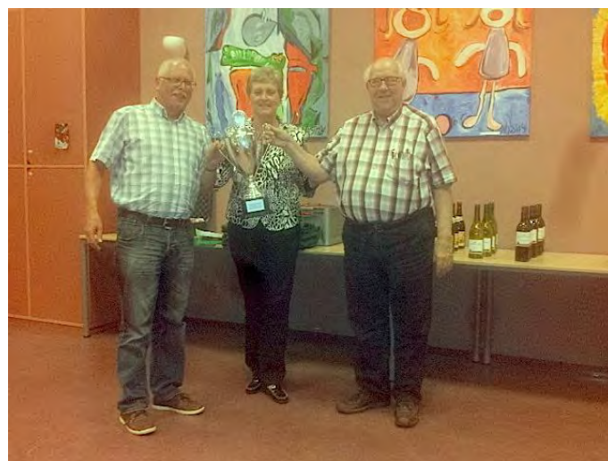
Voorzitter en clubkampioenen 2013-2014