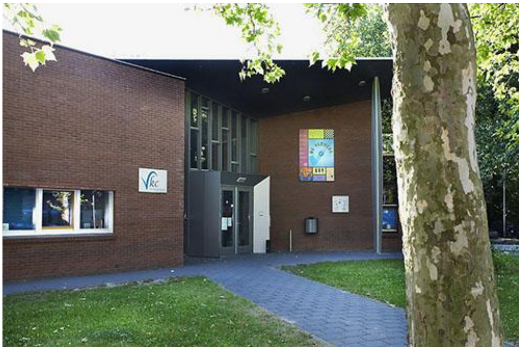
Ons nieuwe bridgehome: Wijkcentrum De Vleugel