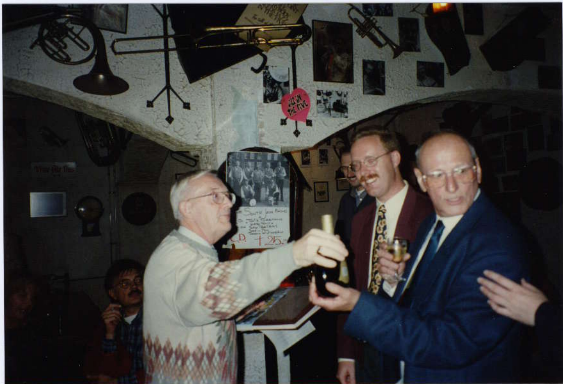
De tweede prijs