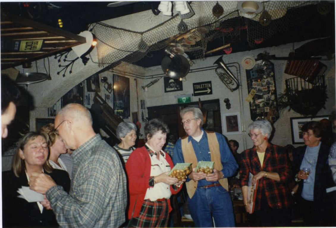
De dertigste prijs