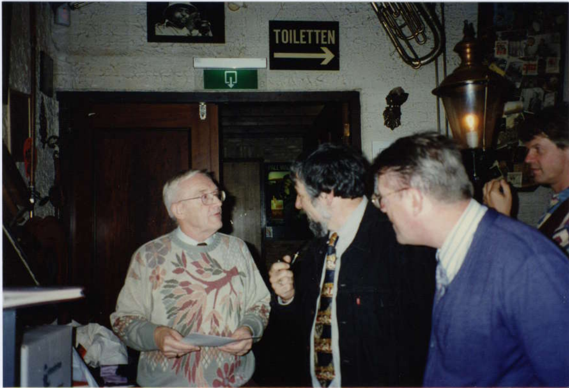
De eerste prijs